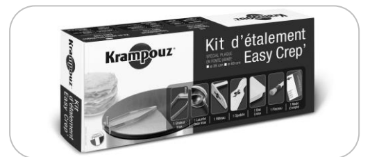
Kit d'étalement AKE84 Spreader kit