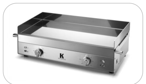
Planchas électriques et gaz Electric and gas planchas