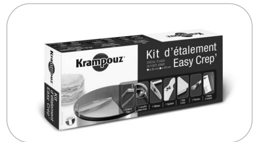
Kit d'étalement Spreader kit AKE84