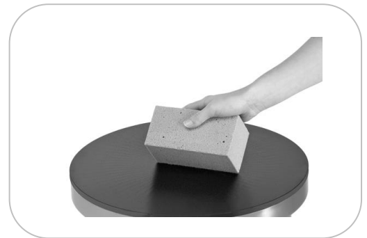
Pierre abrasive Abrasive stone APA1