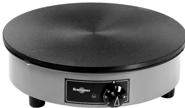
« La Billig »